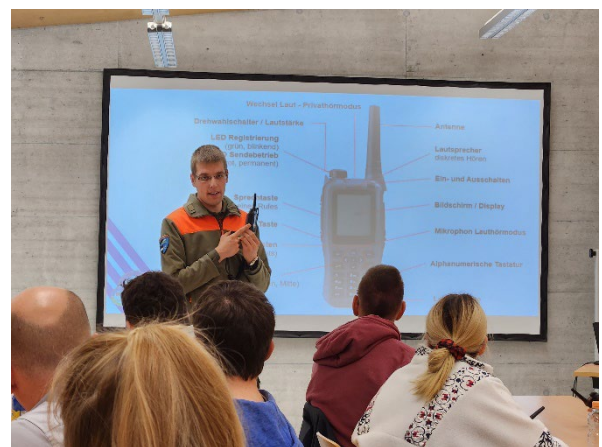
Fachbereich Führungsunterstützung Schulung NTP einer FW

Berichte der Einsätze und Wiederholungskurse unter: www.bevs-zurbiet.ch