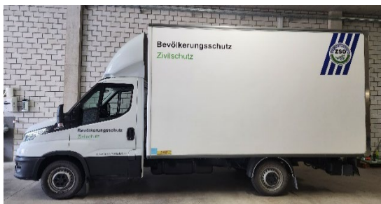
Iveco Daily inkl. Hebebühne und Anhänger MTF (Materialtransport Fahrzeug)

Neu angeschafft wurde nachfolgendes Fahrzeug: