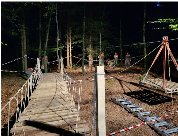
Fachbereich Technische Hilfe Knoten und Bünde