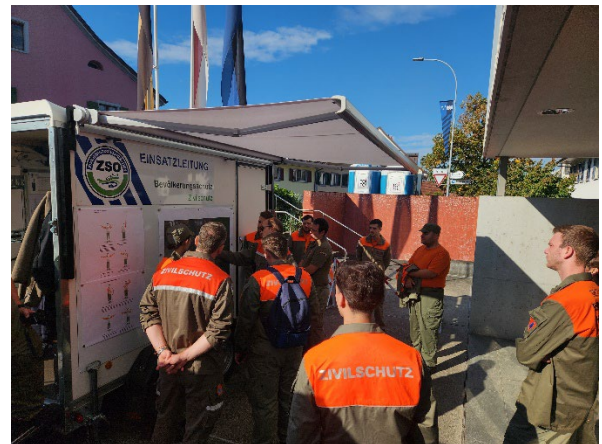
Einsatz Winterfest Einteilung Verkehrsposten